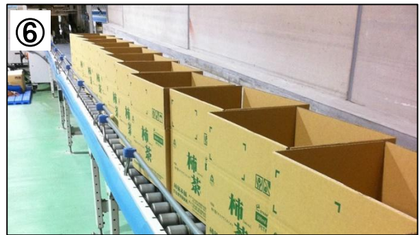
⑥ 箱に詰められてお店や皆様のお手元に届きます！