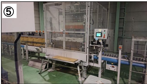
⑤ 最後のチェックも入念に行います