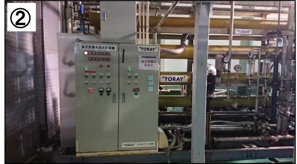
② 水は海洋深層水です