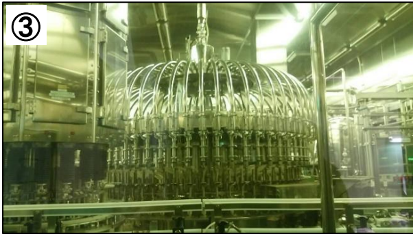
③ 清潔な工場内でペットボトルに充填します