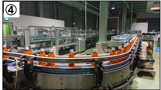
④ 包装されていつもの姿になりました