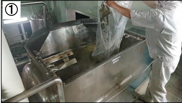
① こだわりの柿茶（次ページ参照）を使います