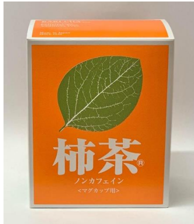
新商品：マグカップ用ティーバッグ（60袋入）

柿茶の定番商品である柿茶®のティーバッグには「作り置きしておける1リットル用」と「飲みたい時にさっと作れるマグカップ用」があります。