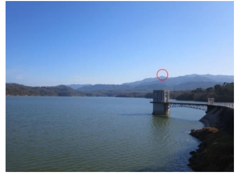
満濃池より望む大川山