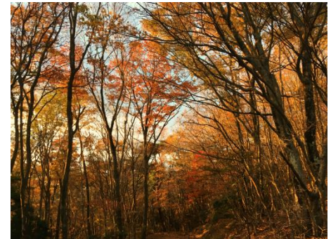
秋の大川山（11月下旬）