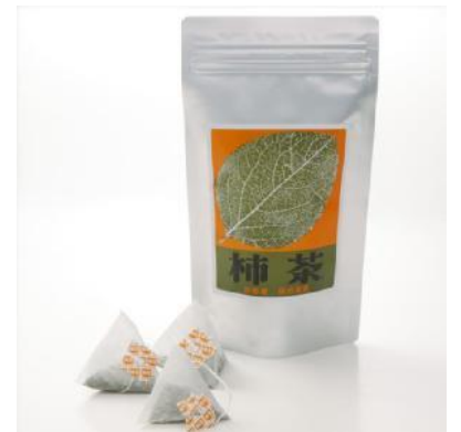
マグカップ用ティーバッグ（1.5g/袋）

また、柿の葉は昔から健康によいと伝えられてきましたが、近年は健康によいとされる成分とその有効性も実証されつつあります（右下の図をご参照ください）。