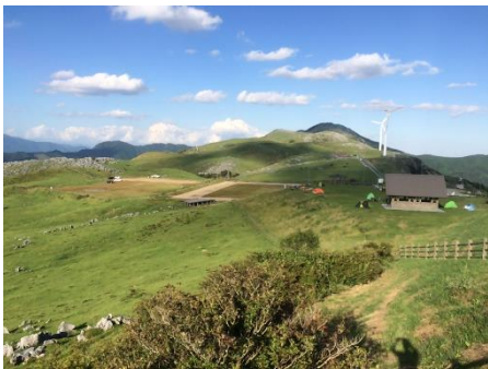
牧草地広がる四国カルスト

参考HP：ツーリズム四国 https://shikoku-tourism.com/feature/karusuto/top